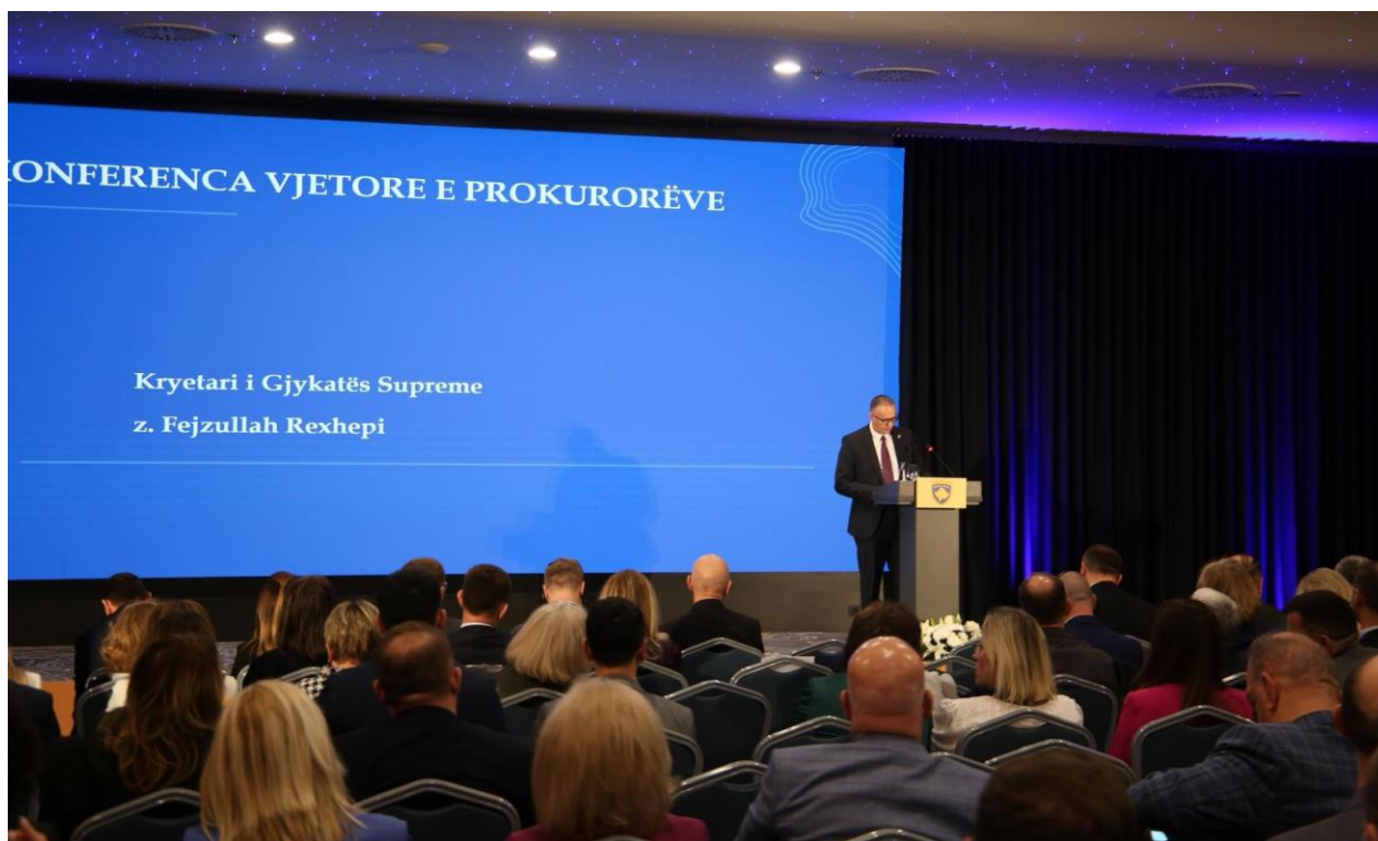
5. Kryetari i Gjykatës Supreme në Konferencën vjetore të Prokurorëve të Shtetit, 2 mars 2024