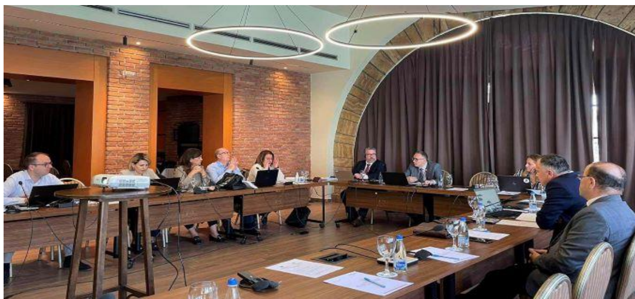
9. Takim i Komisionit Këshillëdhënës për Politikë Ndëshkimore, 28-29 mars 2024

Në tërë procesin e përpilimit dhe tani revidimit të Udhëzuesit të Përgjithshëm për Politikë Ndëshkimore, Gjykatën Supreme e ka mbështetur Zyra OPDAT nga Ambasada Amerikane në Prishtinë.