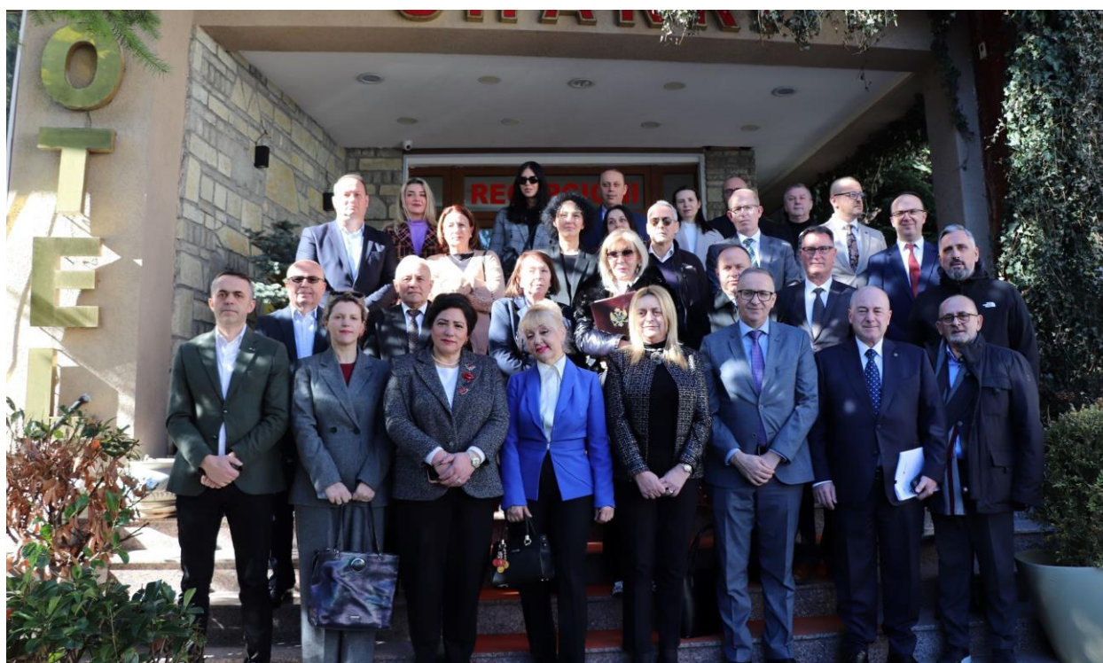
4. Takimi trilateral mes gjykatave supreme të Kosovës, Shqipërisë dhe Malit të Zi, 15-16 shkurt 2024

Gjyqtarët e të tria vendeve kanë shkëmbyer përvojat, me theks në unifikimin e praktikës gjyqësore, pavarësinë e gjyqësorit, të drejtën për proces të rregullt gjyqësor si dhe rëndësinë e bashkëpunimit të tria gjykatave.