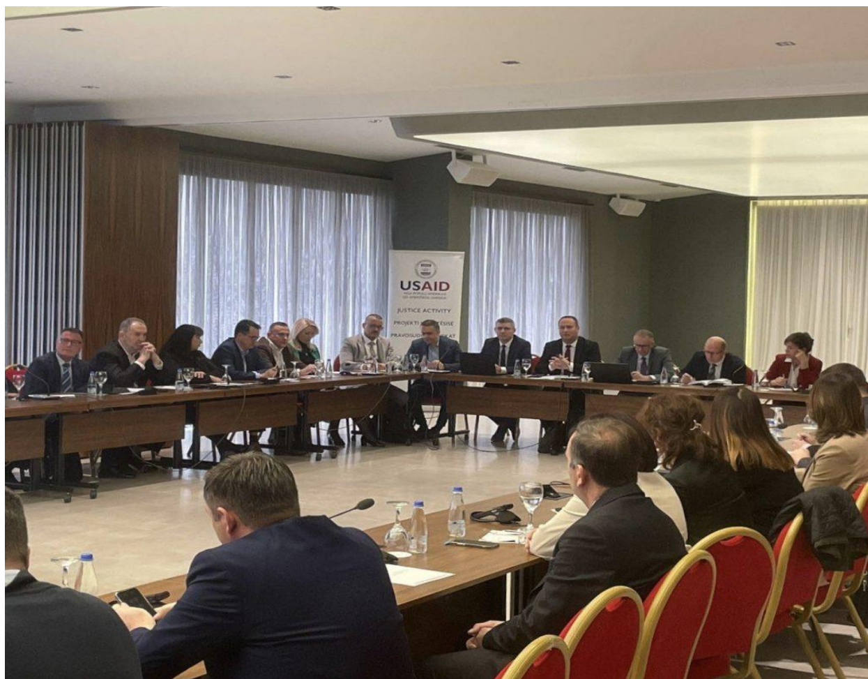
7. Punëtorja lidhur me diskutimin e kthimit të çështjeve në rishqyrtim, 14-15 mars 2024

ndëshkimore dhe sfidat për zbatimin e udhëzuesit; sfidat për trajtimin e rasteve të korrupsionit dhe krimit të organizuar; sfidat në trajtimin e rasteve në familjare, trashëgimore dhe rastet e dhunës në familje; sfidat në administrimin e proceseve gjyqësore, masat e sigurimit të pandehurit në procedurë dhe masat e veçanta hetimore; sfidat për zbatimin të Kodit Penal për të Mitur, etj..