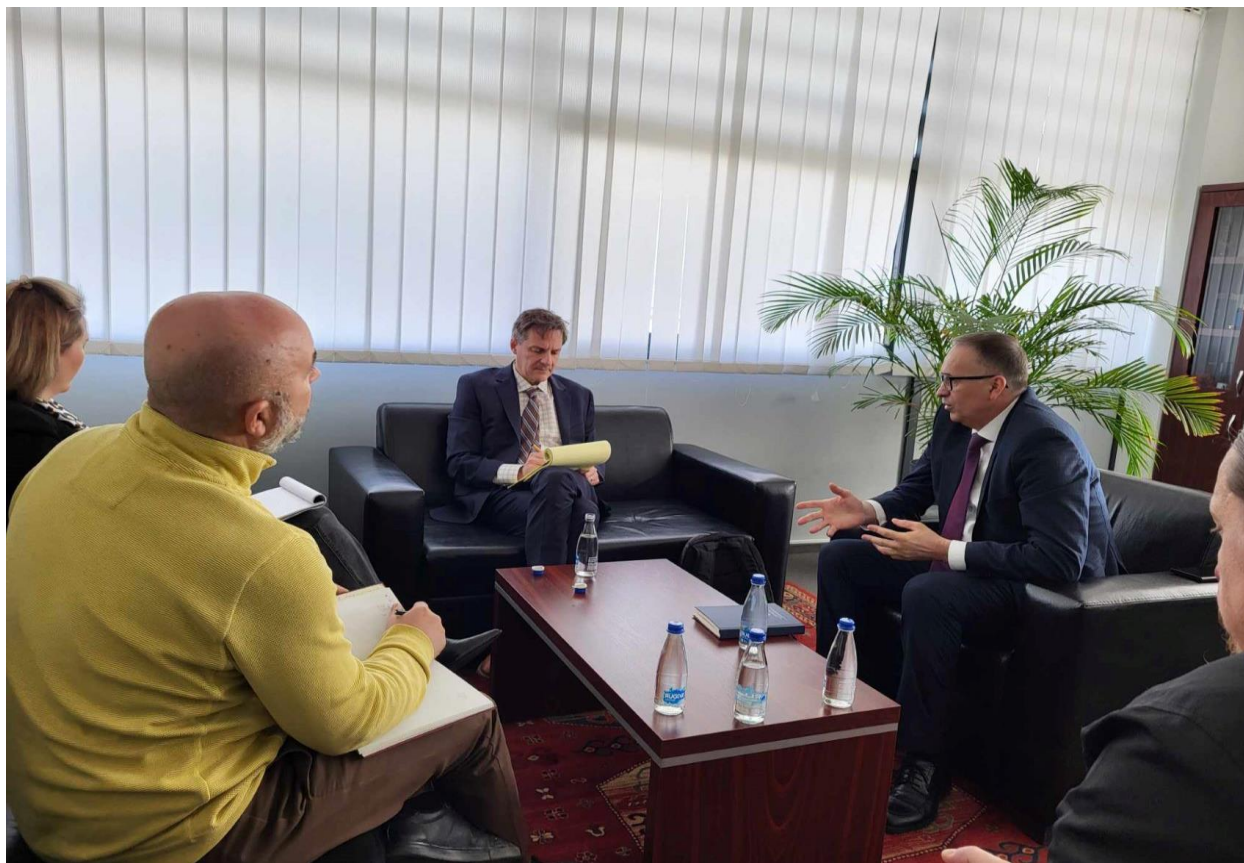
6. Takim me ekipin për vlerësimin e sektorit të drejtësisë, INL, 13 mars

Programi për Çështje Ndërkombëtare të Narkotikëve dhe Zbatim të Ligjit (INL) në Kosovë punon në forcimin e sundimit të ligjit dhe fokusohet në zhvillimin e kapaciteteve të gjyqtarëve, prokurorëve dhe policisë, si dhe në njohuritë e publikut për të drejtat e tyre dhe qasjen në drejtësi.