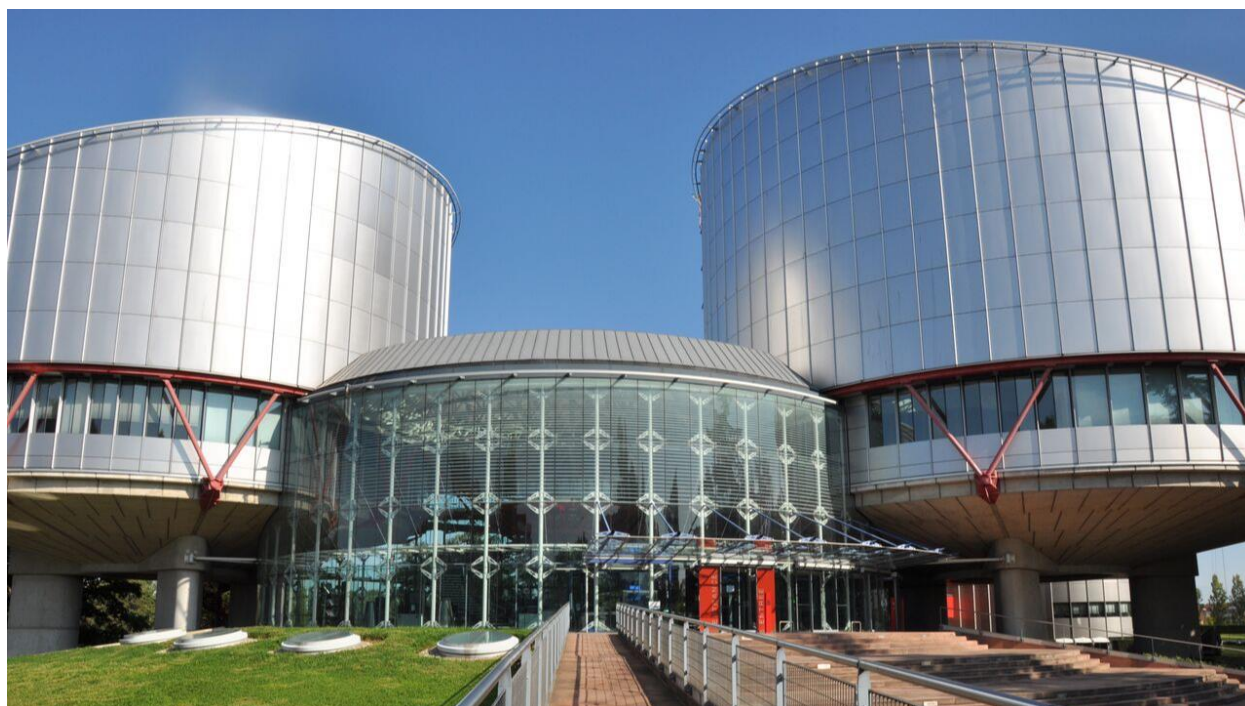
8. Vizita në Gjykatën Evropiane për të Drejta të Njeriut në Strasburg, 20,21 mars 2024