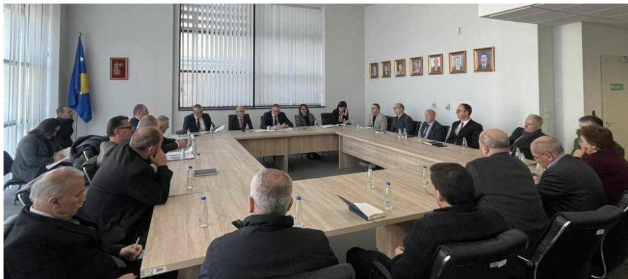
3. Seanca e Përgjithshme e të gjithë gjyqtarëve të Gjykatës Supreme, 23 janar 2024

Në tremujorin e parë të vitit 2024, nën drejtimin e kryetarit të Gjykatës Supreme, Fejzullah Rexhepi është mbajtur një Seancë e Përgjithshme e të gjithë gjyqtarëve të gjykatës, përfshirë edhe gjyqtarët e Dhomës së Posaçme, gjatë të cilës janë miratuar Raporti i Punës së Gjykatës Supreme për vitin 2023 si dhe Plani i Punës për vitin 2024.