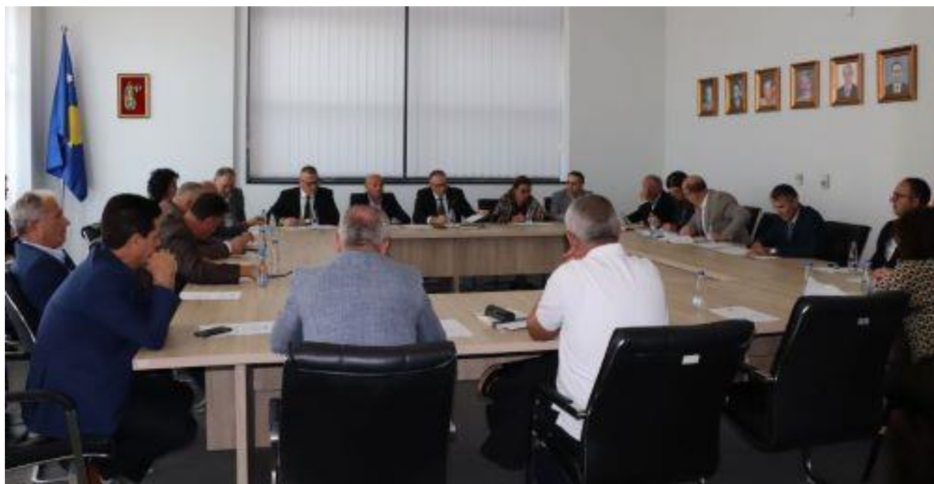
3. Seanca e Përgjithshme e të gjithë gjyqtarëve të Gjykatës Supreme, 9 tetor 2023